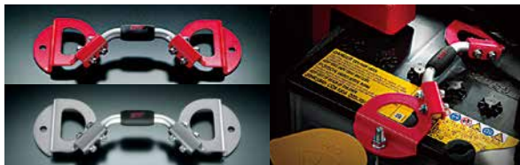
バッテリーホルダー

¥19,140 [¥15,000+税 ¥2,400] ST830315T051 *キーレスアクセス&プッシュスタート装着車用