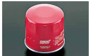
パフォーマンスオイルフィルター

¥4,290 [¥3,900] ●ブラック ST28102Z2000 ●シルバー ST281025T030 *1台分4個セット、アルミ削り出し、*アルマイト処理