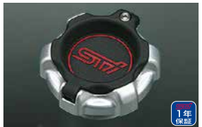
オイルフィルターキャップ

¥5,170 [¥3,500+税 ¥1,200] ST1525Z2011 *チェリーレッド塗装