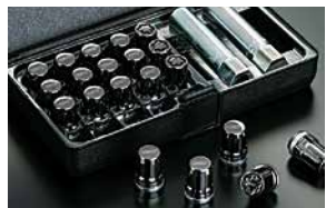
セキュリティホイールナットセット

¥44,000(工賃別) [¥40,000+税工賃別] ST281705T060 工賃は販売店にお問い合わせください *ガンクグ色、1台分ラグナット16個、ロックナット4個セット、専用工具2個入り。