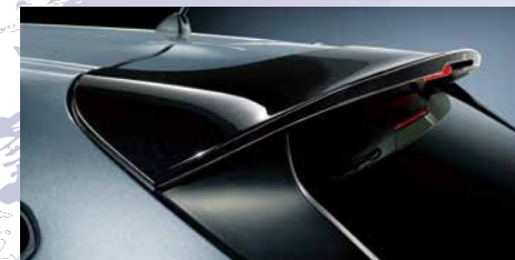
リヤルーフスポイラー

SUBARU純正アクセサリです。 CROSSTREKアクセサリカタログをご覧ください。