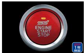
プッシュエンジンスイッチ

¥5,060 [¥3,400+税 ¥1,200] ST451375T001 *交換時は各配管部からの水もれに注意し、冷却水の地漏点検を必ず行ってください。