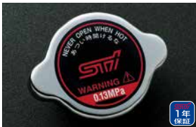
ラジエーターキャップ

¥11,880 [¥8,800+税 ¥2,000] ST1525Z2011 *ガasketは同梱しておまかせ。取り出したフィルターキャップに組み立てるものをご使用ください。ガasketを新品で用意の際は、必ず装着車種の純正部品をご確認ください。