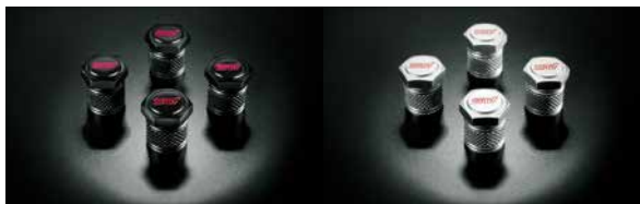
バルブキャップセット

¥44,000(工賃別) [¥40,000+税工賃別] ST281705T060 工賃は販売店にお問い合わせください *ガンクグ色、1台分ラグナット16個、ロックナット4個セット、専用工具2個入り。