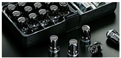
セキュリティホイールナットセット