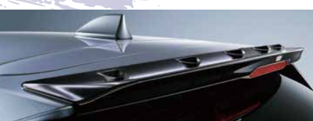
ルーフエンドスポイラー

※写真はイメージです。実際の商品と異なる場合があります。 実際の商品取付けは取付・取扱説明書に従って取付けしてください。 ※表示価格は標準工賃(必要な場合)と消費税10%を含むメーカー希望小売価格。 併記の[]は消費税抜の[メーカー希望本体価格+税標準工賃]です。 工賃別商品の工賃は販売店にお問い合わせください。 尚、新車装着時以外で装着する場合は、作業内容に応じ別途追加工賃がかかる場合がございます。 詳しくは販売店にお問い合わせください。