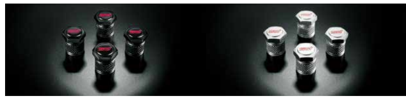
バルブキャップセット