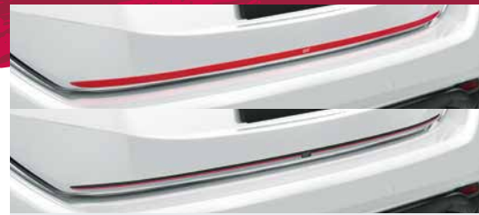
テールゲートガーニッシュ

※長時間、雨水など水分が付着した状態に置かれた場合、表面が白く濁ることがありますが、使用している材質(PVC)の特性で異常ではありません。乾燥すると復元します。