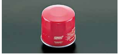
パフォーマンスオイルフィルター