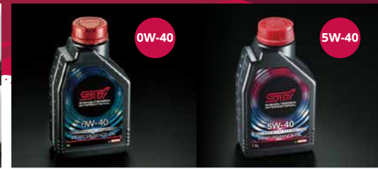
STIパフォーマンスオイル

テールゲート下部に貼り付けるガーニッシュです。単色の「チェリーレッド」タイプと、ブラック/チェリーレッド/シルバー3色の「コンビ」タイプを用意しました。耐候性に優れた特殊樹脂「ハイボスカル」を素材に用いています。