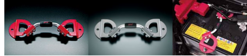
バッテリーホルダー