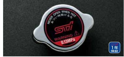
ラジエーターキャップ