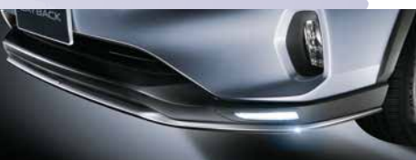
フロントアンダースポイラー

SUBARU純正アクセサリです。 LAYBACKアクセサリカタログをご覧ください。