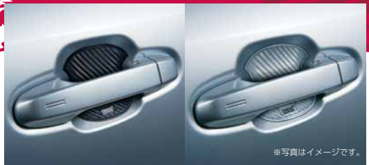
ドアハンドルプロテクター

※写真はイメージです。実際の商品と異なる場合があります。 実際の商品取付けは取付・取扱説明書に従って取付けしてください。 ※表示価格は標準工賃(必要な場合)と消費税10%を含むメーカー希望小売価格。 併記の[]は消費税抜の[メーカー希望本体価格+税標準工賃]です。 工賃別商品の工賃は販売店にお問い合わせください。 尚、新車装着時以外で装着する場合は、作業内容に応じ別途追加工賃がかかる場合がございます。 詳しくは販売店にお問い合わせください。