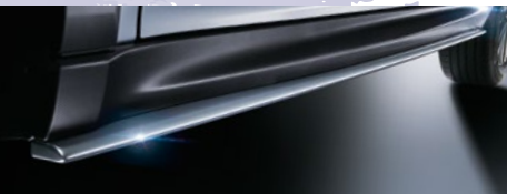
サイドアンダースポイラー