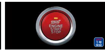
プッシュエンジンスイッチ