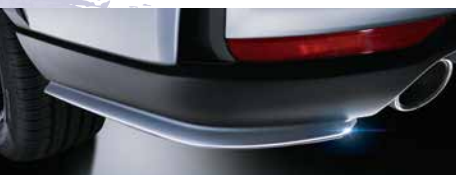
リアサイドアンダースポイラー